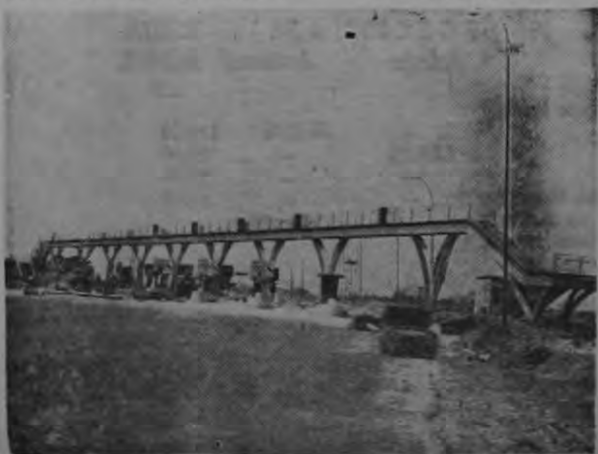
Puesto de Peaje sobre la autopista de NORMANDIE (Francia) (en construcción).