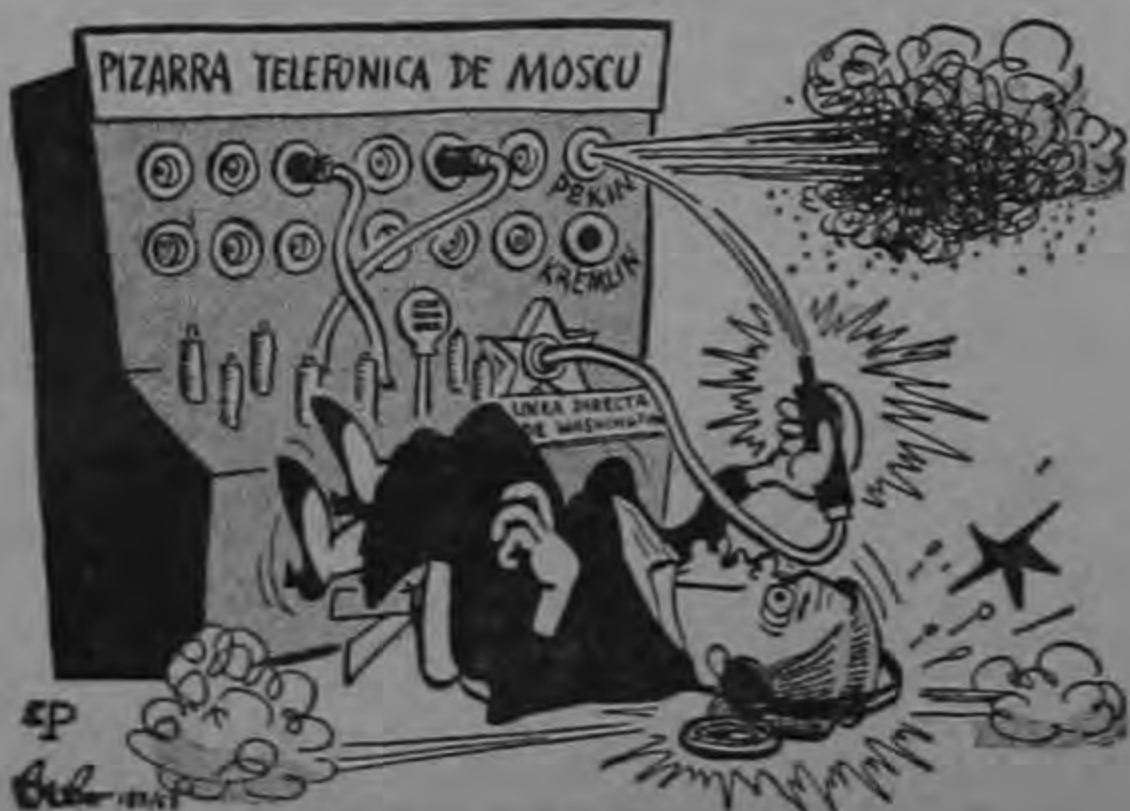
*¡DEMONIOS! OTRO CORTOCIRCUITO.*

El senador Benedito Calazans, que es sacerdote católico, protestó contra la caricatura ayer en Brasilia en un discurso que pronunció en el Senado.