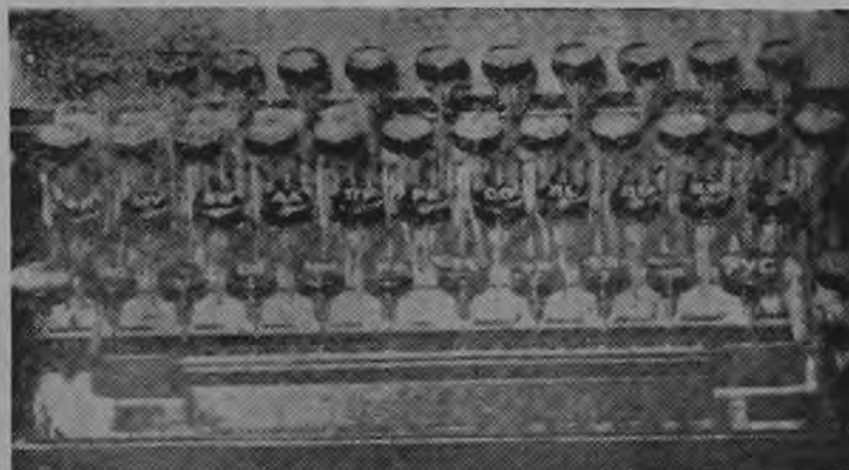
La foto muestra el teletipo ruso que ha sido instalado en el Pentágono en Washington para la línea "caliente" (hot line) de comunicaciones entre el Kremlin y la Casa Blanca. Las teclas tienen caracteres rusos y los mensajes serán enviados y recibidos a la vez en inglés y ruso para evitar errores de la traducción.